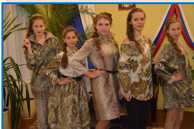
9 октября. Благотворительный ситцевый бал.