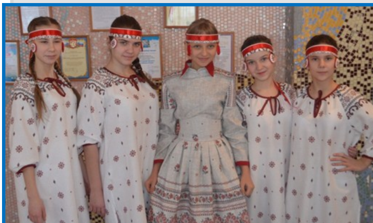
30 января . Районный конкурс для одарённых детей «Минута Славы»