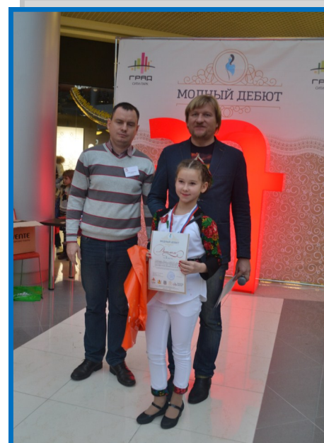
12 декабря . Областной конкурс- фестиваль «Модный дебют»