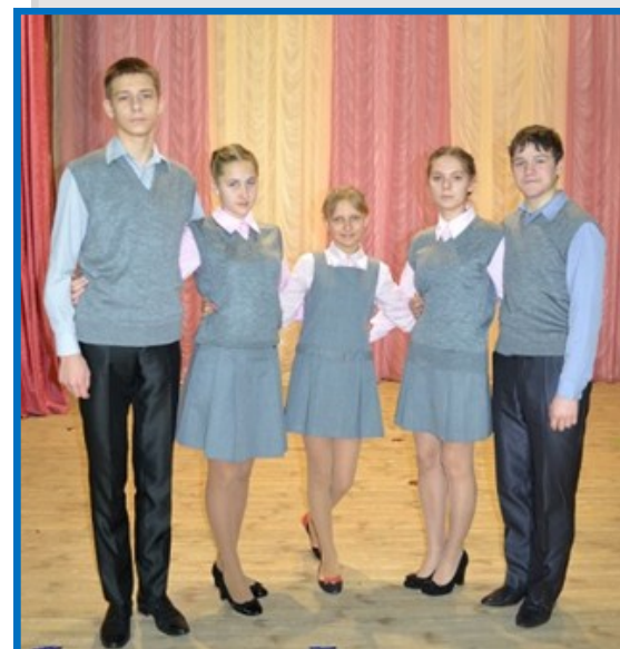
12 февраля. Районный конкурс социально-значимых проектов “Имён пылает строчка золотая”