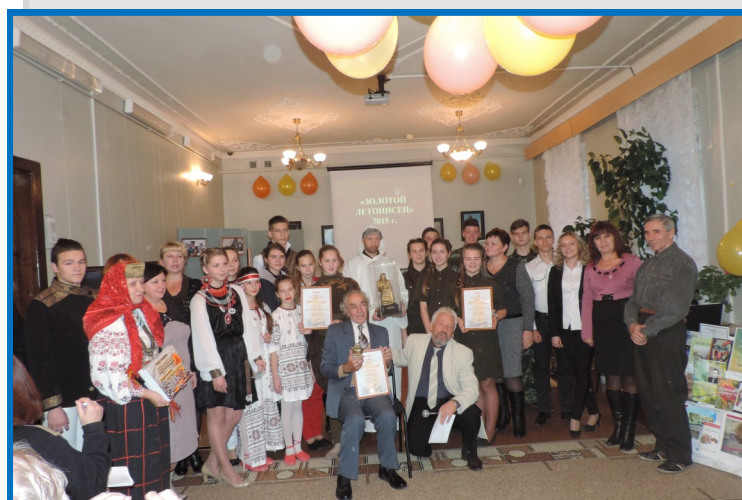
22 октября. «Золотой летописец»