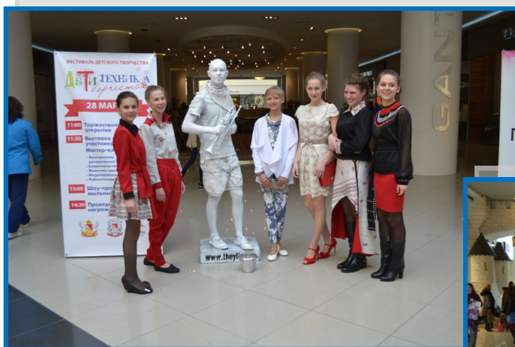
28 марта . Областной фестиваль «Дети, техника, творчество»