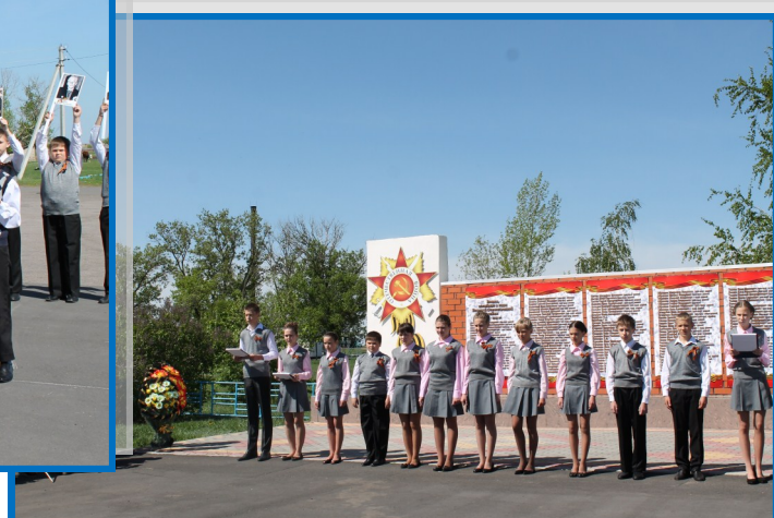
9 мая 2015 года. 70 лет Великой Победы.