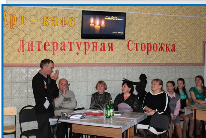
27 ноября . Арт-кафе «Литературная СтоРОЖка»